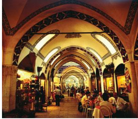
شكل رقم (٣)